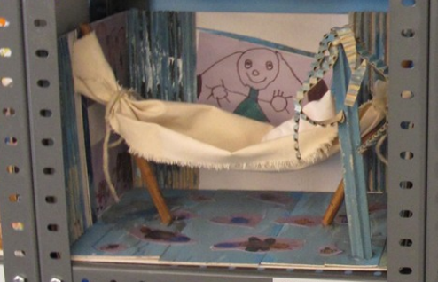
18/11/2008 Vila Nova de Gaia 18/11