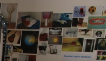
Dossiers para consulta