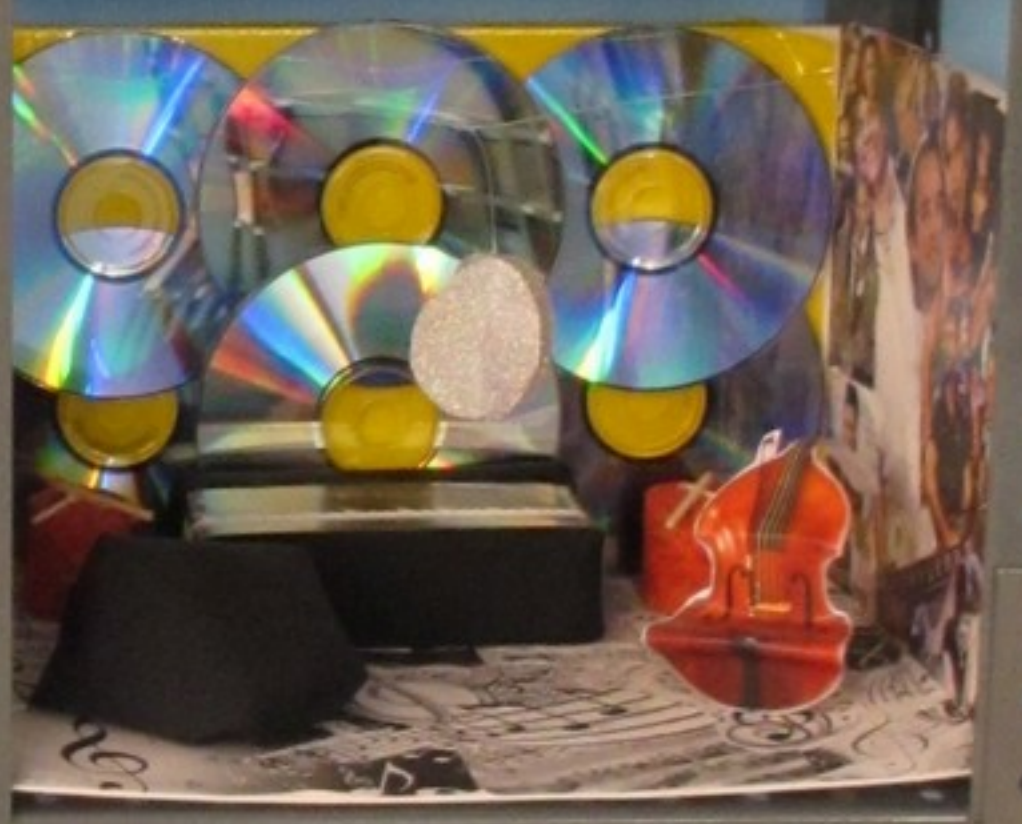
OSMOPE Porto ATI