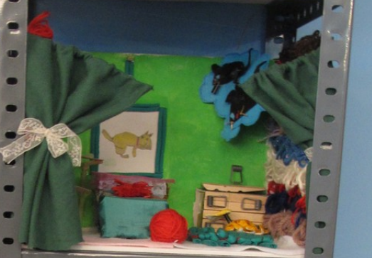
18/11/2008 Provincia de Alton Gandumar 18/11