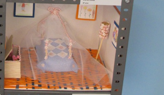
18/11/2008 Carrizal de Paraiso Buenos Aires 18/11