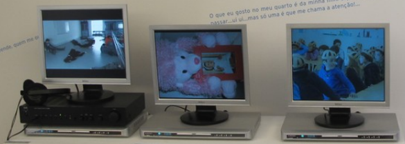
Ligo o portátil e estou no meu verdadeiro quarto.