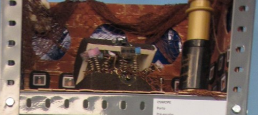
18/11/2008 Paris 18/11