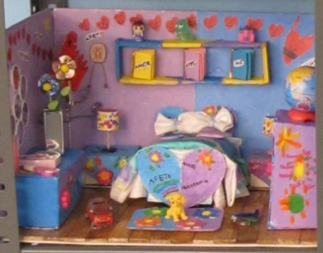
EB/3 Barcelo Valongo Pré-escolar