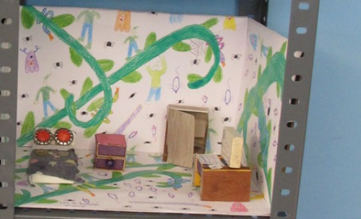
18/11/2008 Vila de Ganda 18/11