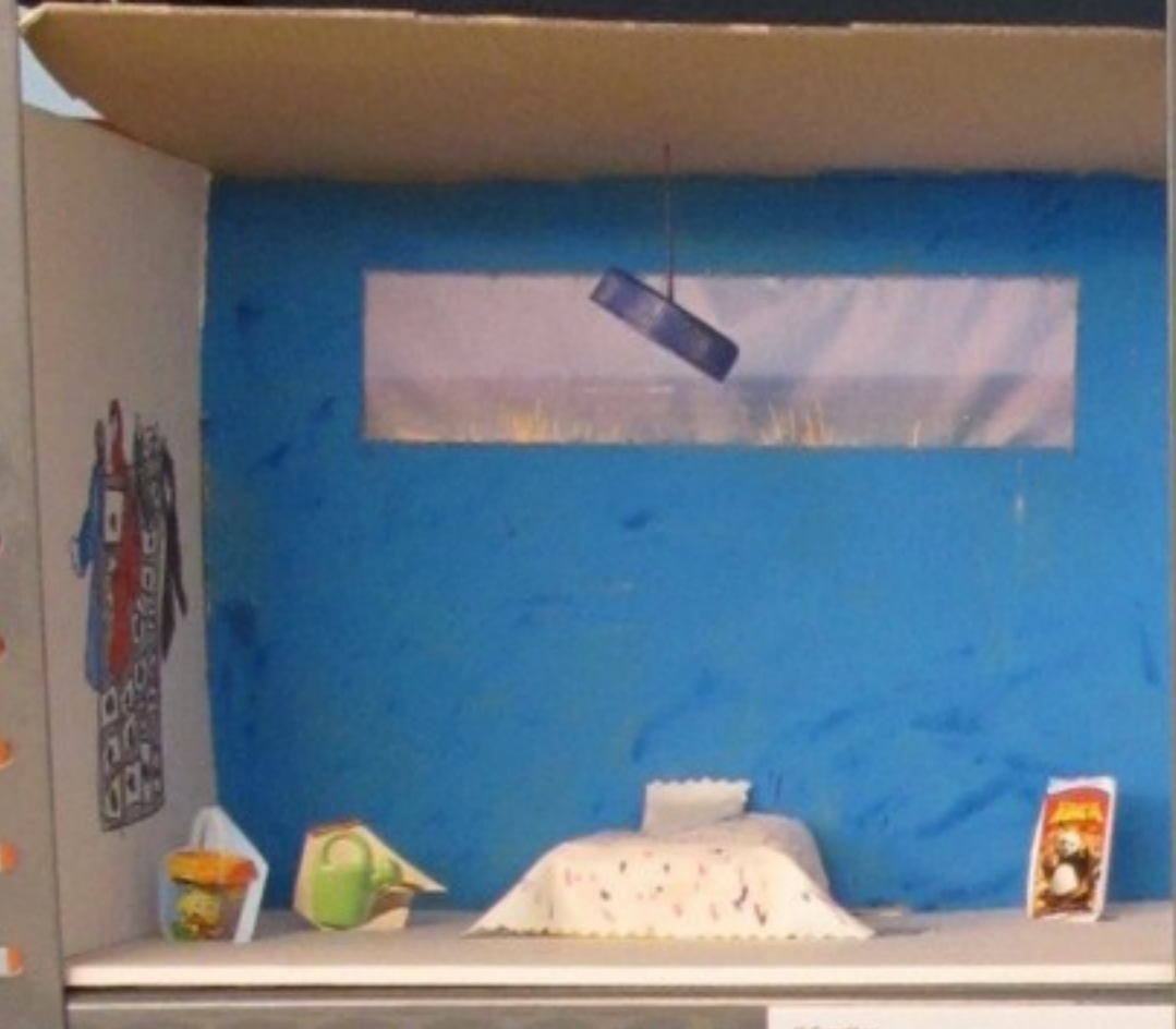
3º Crestim Gondomar Pré-escolar