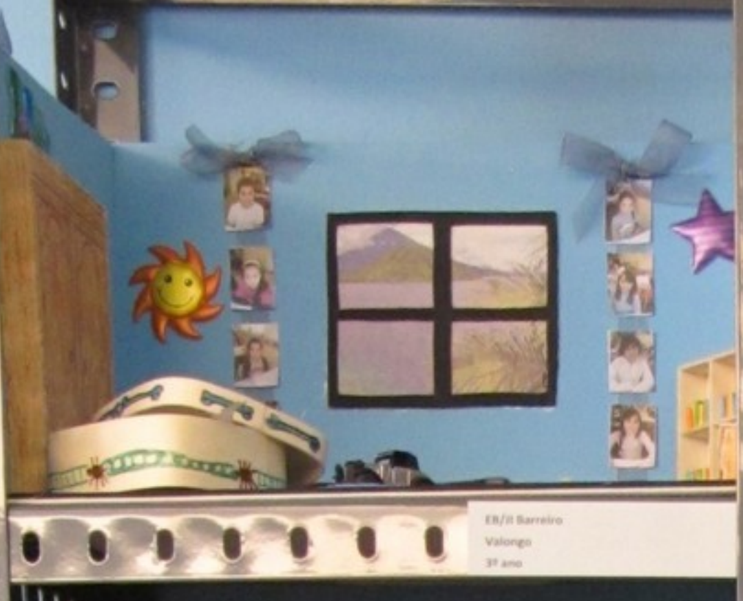
EB/3 Barcelo Valongo 3º ano