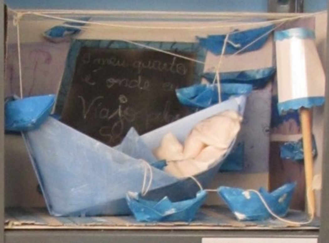
Colégio Oceanus Vila Nova de Gaia Pré-escolar