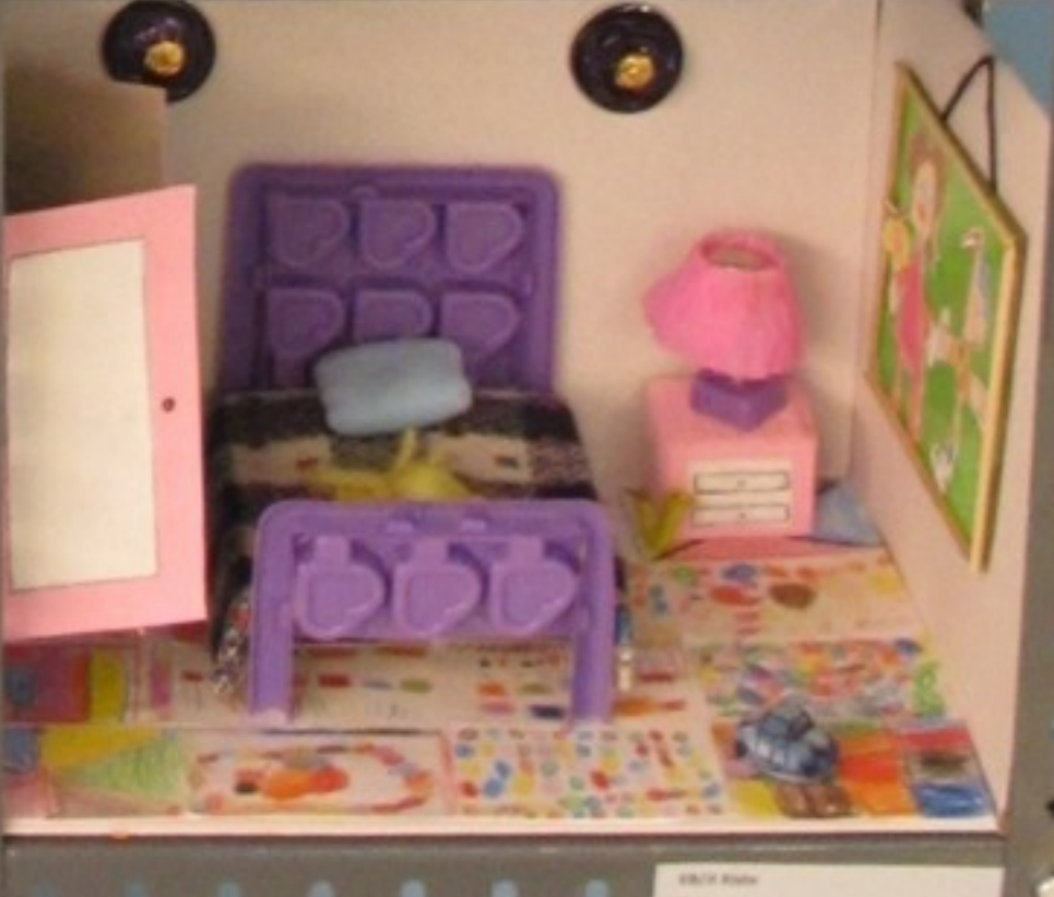
EB/3 Vila Valongo Pré-escolar