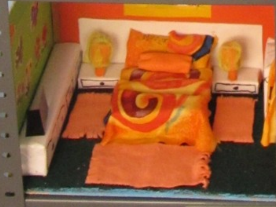
EB/3 Vila Valongo Pré-escolar