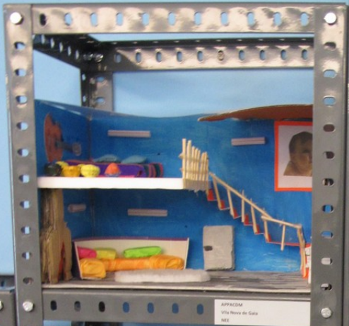
18/11/2008 Vila Nova de Gaia 18/11